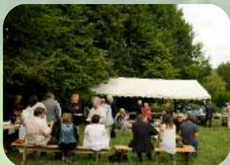
Dimanche 1 er septembre La pause des auteurs locaux