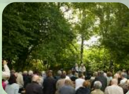
Dimanche 1 er septembre ....dans la verdure.