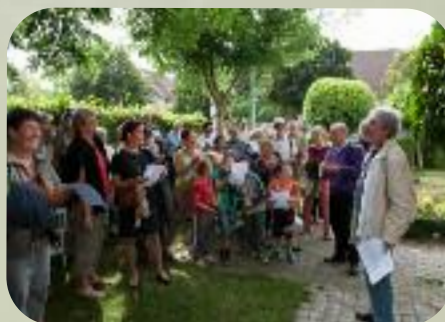
Samedi 7 septembre Sézanne : ballade balade