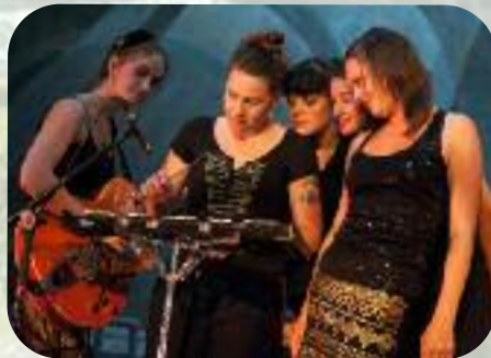
Dimanche 8 septembre Portrait de famille « Face à la mer »