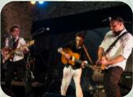
Dimanche 8 septembre Bergères-sous-Montmirail Villa Ginette, c'est pas de la piquette