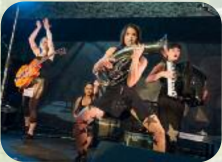
Dimanche 8 septembre Des rockeuses élégantes, qui ont engrangé le public