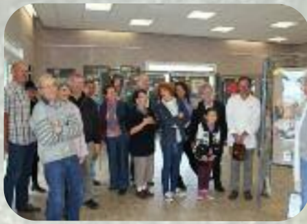
Dimanche 15 septembre Morsains