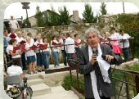
Samedi 31 août Escale musicale