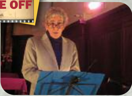
Samedi 14 septembre Soizy-aux-Bois : La chanson du Poilu