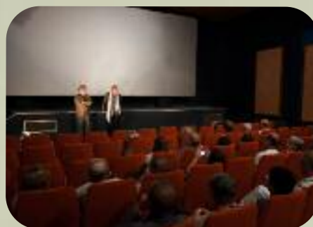
Mardi 3 septembre Montmirail le Don Camillo ciné club