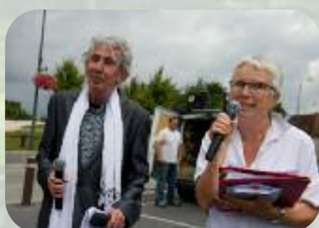
Samedi 31 août Ballade, balade Montmirail : embarquement