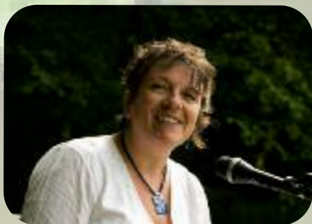
Dimanche 1 er septembre Lectures de « le goût de la chanson »