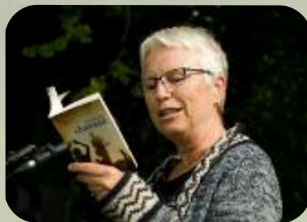
Dimanche 1 er septembre Lectures