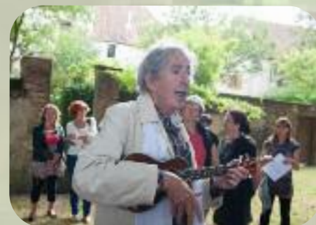
Samedi 7 septembre avec finale en chansons et yukulélé