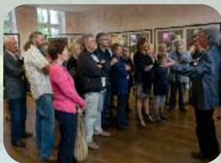
Samedi 31 août Verdon visite guidée de « Paris qui chante »