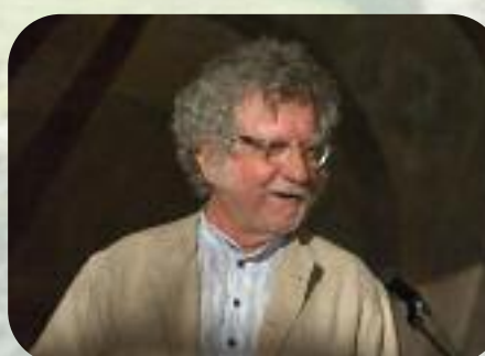
Samedi 31 août La Grange Le programme, tout le programme