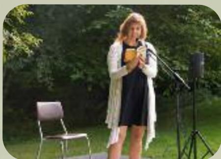
Dimanche 1 er septembre Lectures