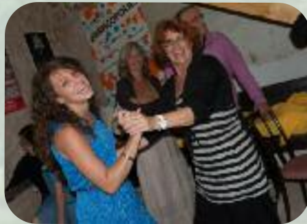
Dimanche 8 septembre Au plaisir des spectatrices