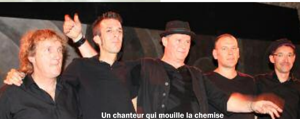
Un chanteur qui mouille la chemise

Un vieux proverbe résume bien la chose : « les absents ont toujours tort ».