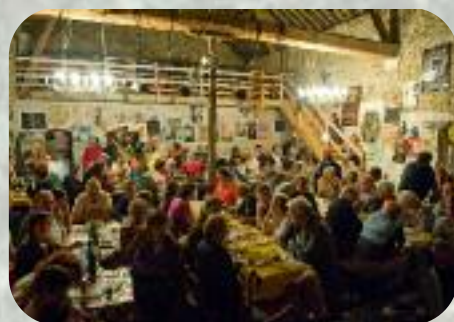
Samedi 31 août Deux personnages du Festival : La Grange, le public