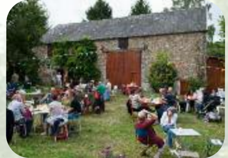
Dimanche 8 septembre Petit pique-nique avant le concert