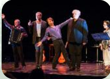
Samedi 7 septembre Ils sont 4 + Gigi (spectatrice ravie)