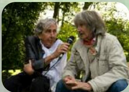
Dimanche 1 er septembre Boissy le Repos, l'interview de Leny Escudero