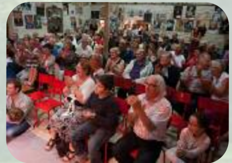
Dimanche 8 septembre Et toujours la grange