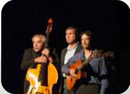
Samedi 7 septembre Le Prétoire Entre 2 caisses, ils sont 3 ?

Voyage en chansons françaises, 9 jours culturodistrayants dans la vallée du Petit Morin (suite)