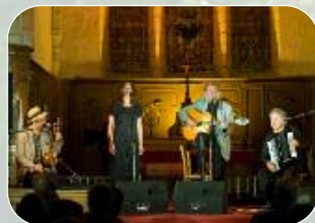
Vendredi 30 août Vauchamps, Papiers d'Arménie Concert inaugural

et... Barcella, jeune parrain talentueux et généreux !!!