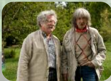
Dimanche 1 er septembre Ils sont mimi tous les deux...