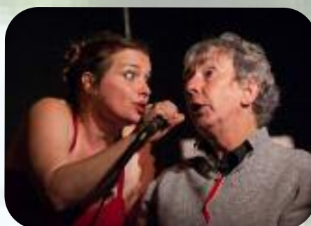
Vendredi 6 septembre Duo surprenant