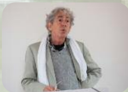
Samedi 7 septembre Le Thout Trosnay : conférence champagne et chanson