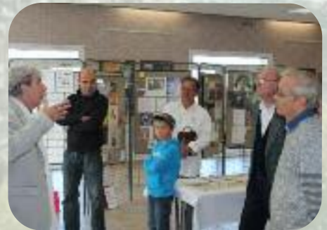
Dimanche 15 septembre La chanson en expo