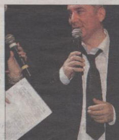
Un public enjoué. Un président satisfait.